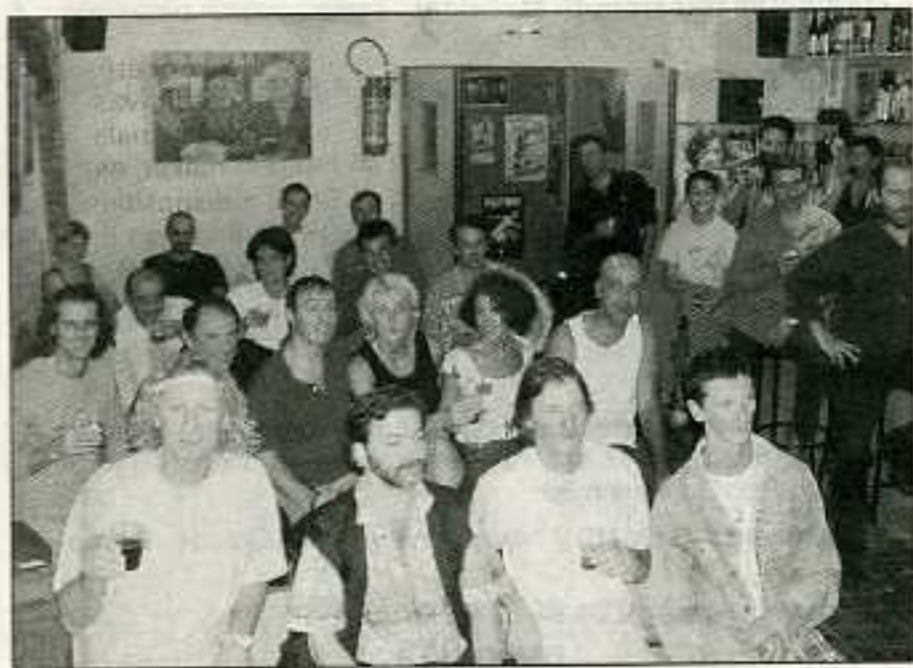
Comédiens, chanteurs, humoristes, acteurs du « Constroy » sont prêts à accueillir le public.

La cave de la rue Berny a su conserver, malgré la canicule, la tête fraîche et l'esprit clair, comme ceux qui l'animent et qui ont présenté le programme de ce premier trimestre de reprise.